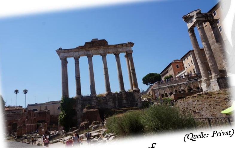
Der Tempel des Saturn auf dem Forum Romanum, Rom