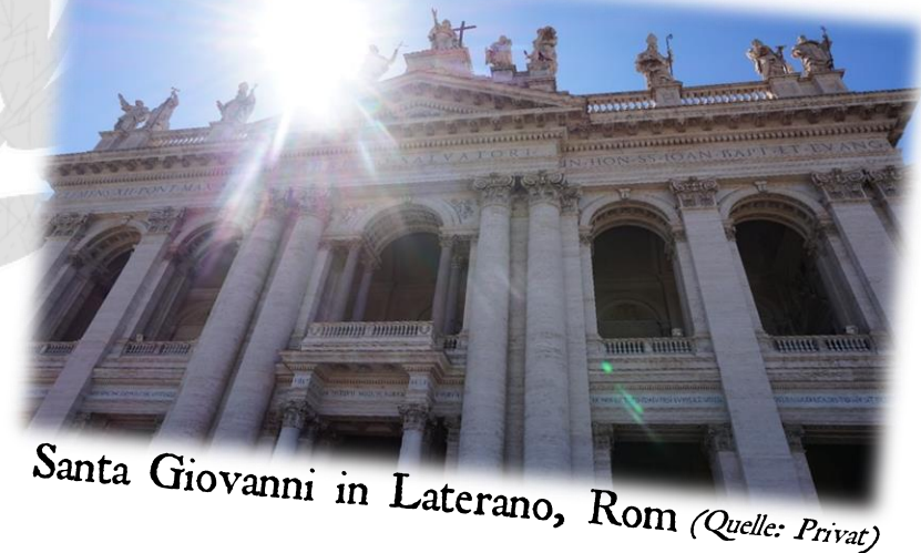
Santa Giovanni in Laterano, Rom