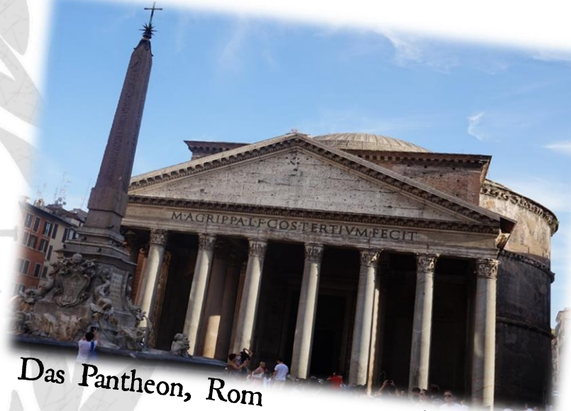
Das Pantheon, Rom