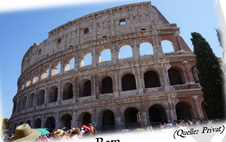
Das Colosseum, Rom

Exkursionen, zum Beispiel nach Rom, Kalkriese oder Trier